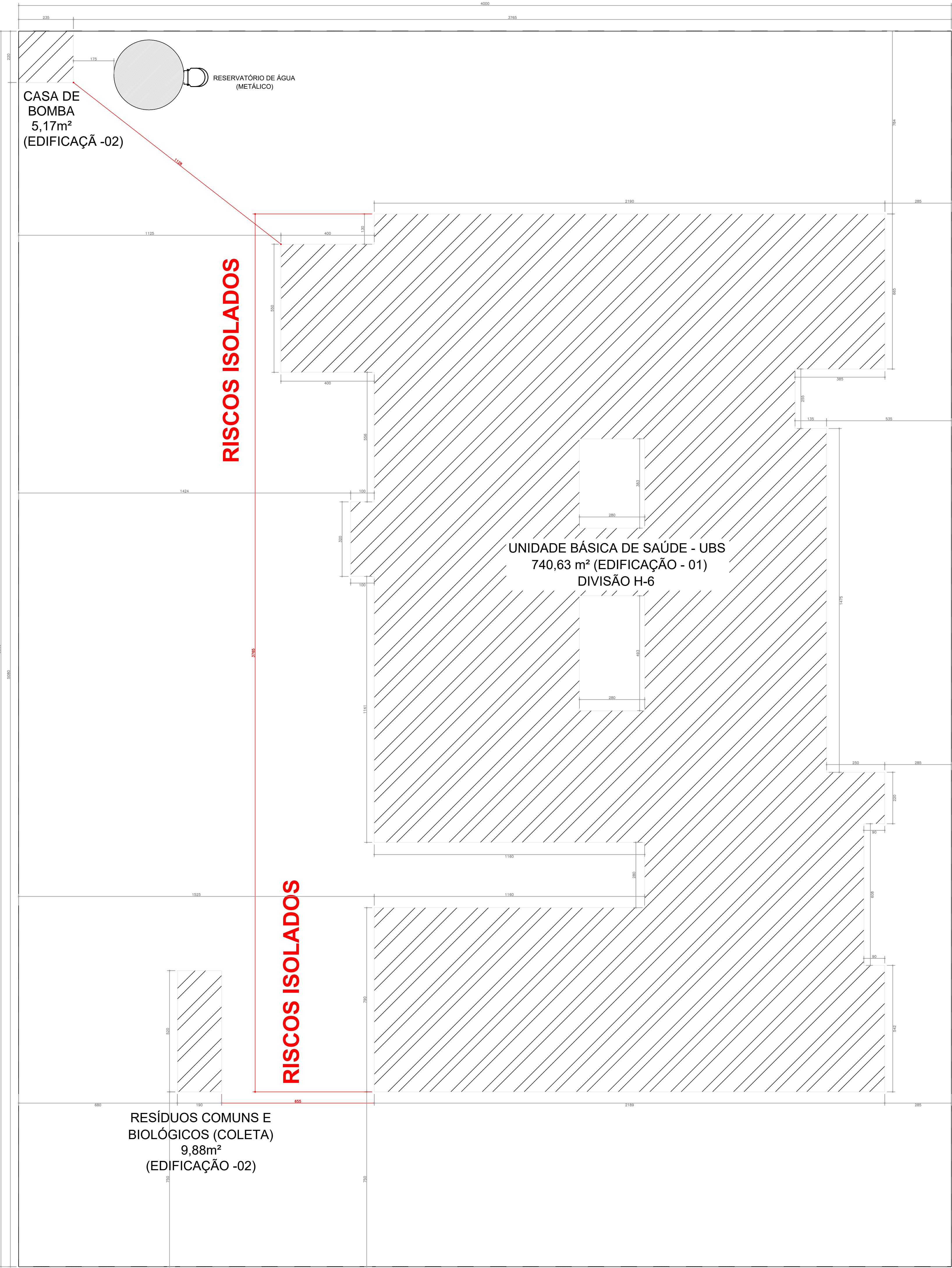
IMPLANTAÇÃO • ESCALA: 1/100